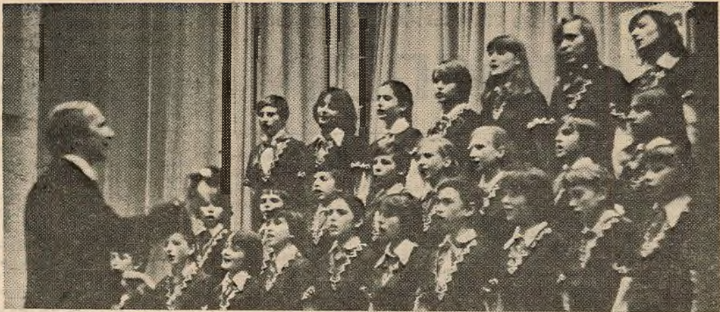
Выступае дзіцячы хор — удзельнік святкавання 60-годдзя ўніверсітэта.